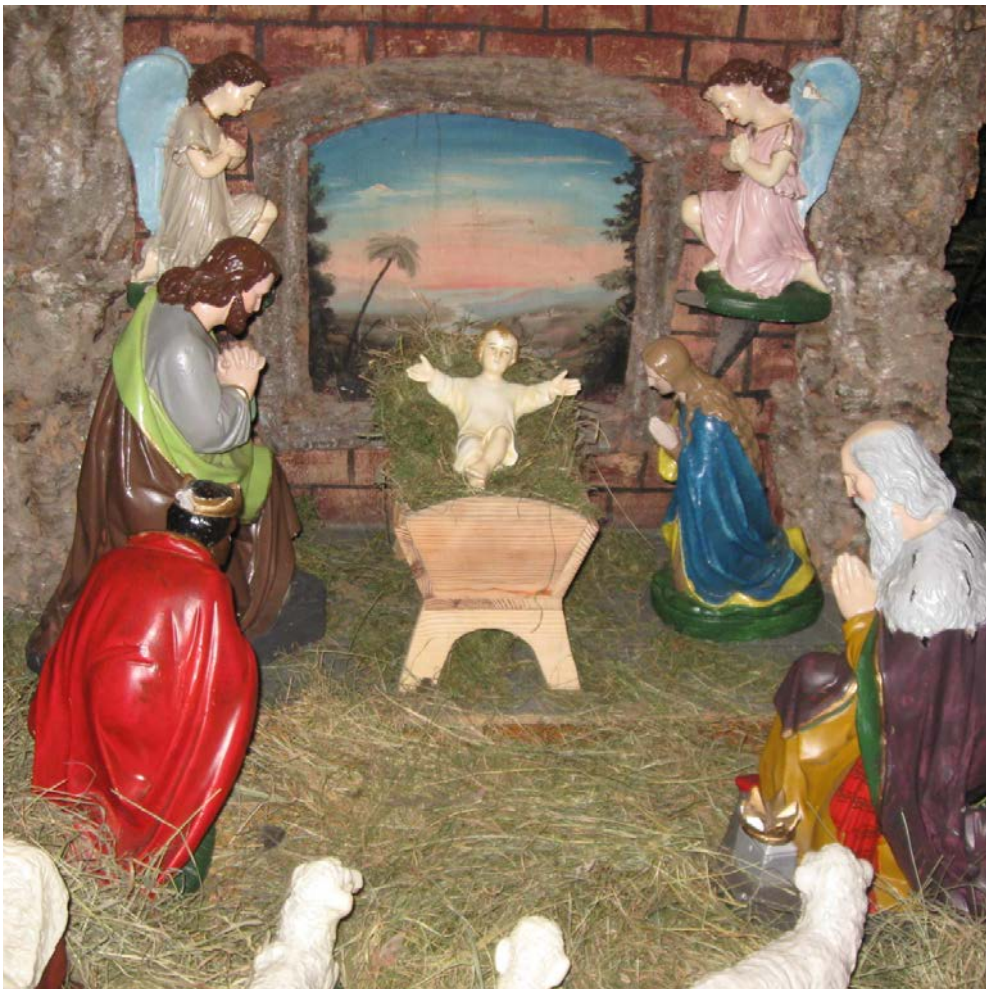
(anlässlich des 20jährigen Partnerschaftsjubiläum von Lichtenau / Lechowo(Polen)) Krippe in Lechowo