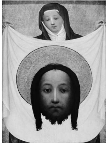
Meister der hl. Veronika, um 1420

Wie der Legende nach Veronika Jesus das Schweißstuch reichte, reiche ich ihm meine Aufmerksamkeit, sodass er sich tiefer in mich einprägt.