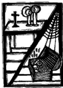
Die Logik der Welt treibt uns zum Erfolg, zur Herrschaft und zum Geld; die Logik Gottes zur Demut, zum Dienen und zur Liebe. Papst Franziskus

über die Gerechtigkeit spricht, entsteht ein Missverhältnis“ (Nr. 38). Zentral sind nicht Gesetze und Verbote. Zentral sind Liebe, Gnade - und die Barmherzigkeit. Barmherzigkeit ist die größte aller Tugenden. Keinen geringeren als den heiligen Thomas von Aquin zitiert Papst Franziskus in seinem Apostolischen Schreiben, um das zu unterstreichen. Auch der heilige Thomas sieht in der moralischen Botschaft der Kirche schon eine „Hierarchie“, so der Papst. Und die Barmherzigkeit, die steht auch bei ihm an oberster Stelle. Thomas von Aquin schreibt: „An sich ist die Barmherzigkeit die größte