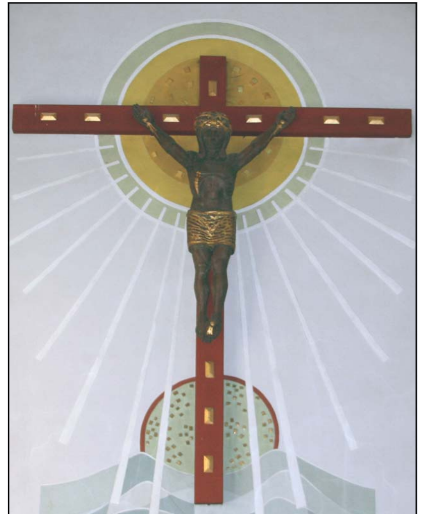
- Kreuz im Altarraum der Herbramer Kirche